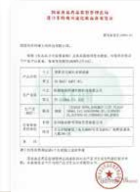
ES 마운 아쿠아겔 위생허가증