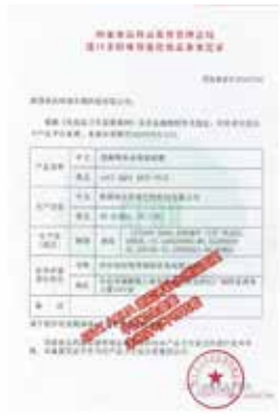
esV1 아쿠아 위생허가증