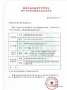
esV1 콜라겐 위생허가증