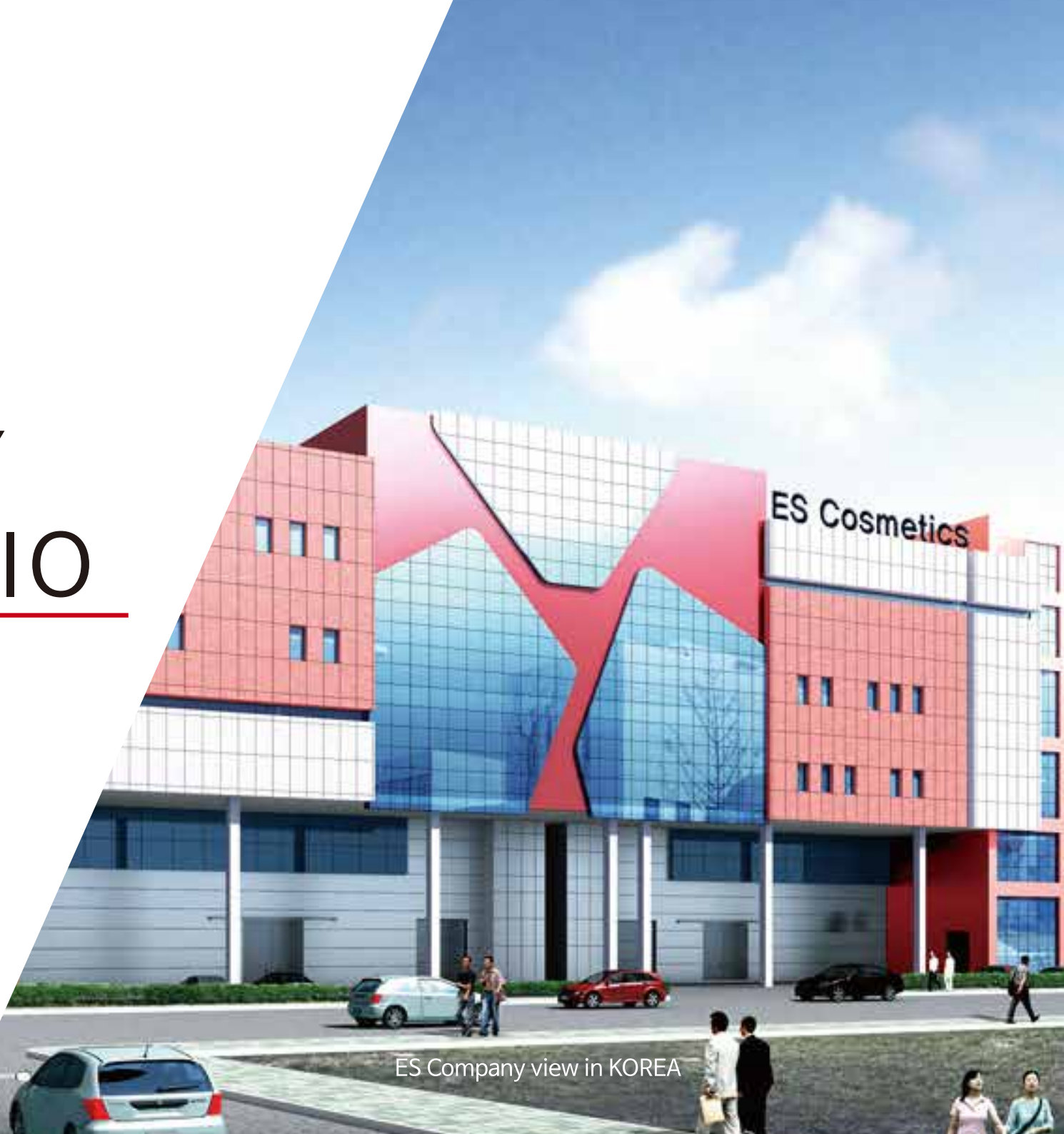
ES Company view in KOREA