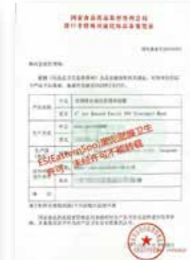
ES 세보테 위생허가증