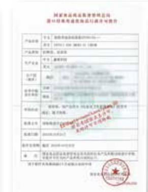
러블리수 씨씨 크림 위생허가증