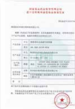
esV2 아쿠아 위생허가증