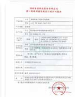
esV1 블랙 위생허가증