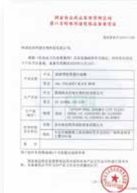
esV2 콜라겐 위생허가증